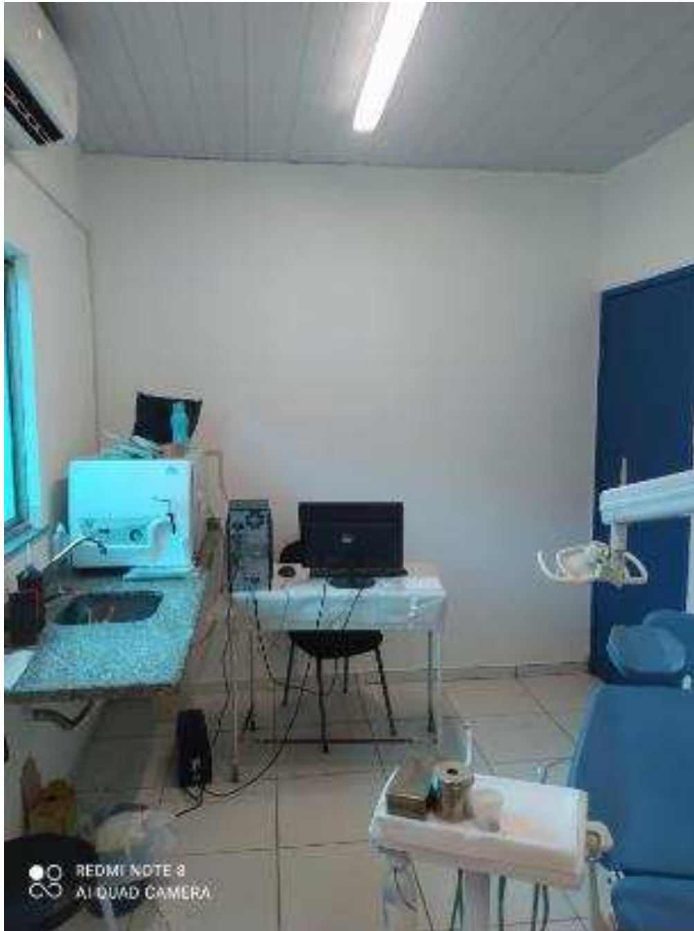
UBS - PINDOBA Rua Principal, n 140 - Pindoba