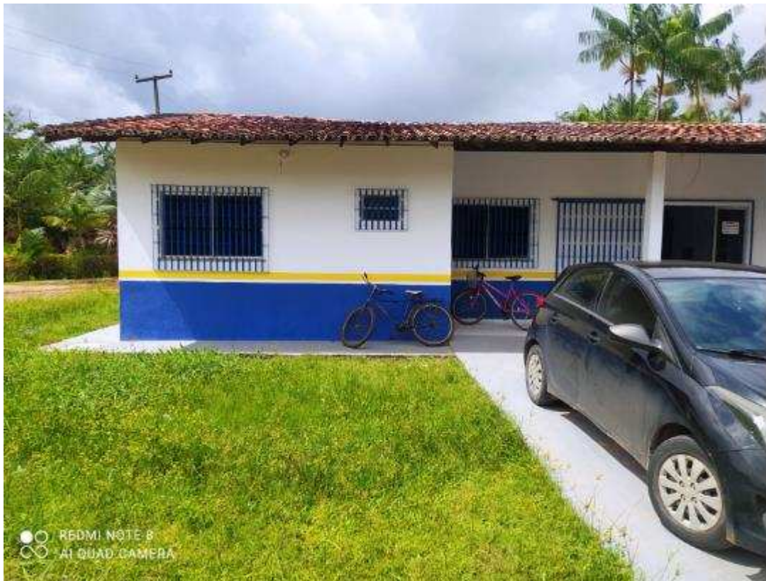
UBS - PINDOBA Rua Principal, n 140 - Pindoba