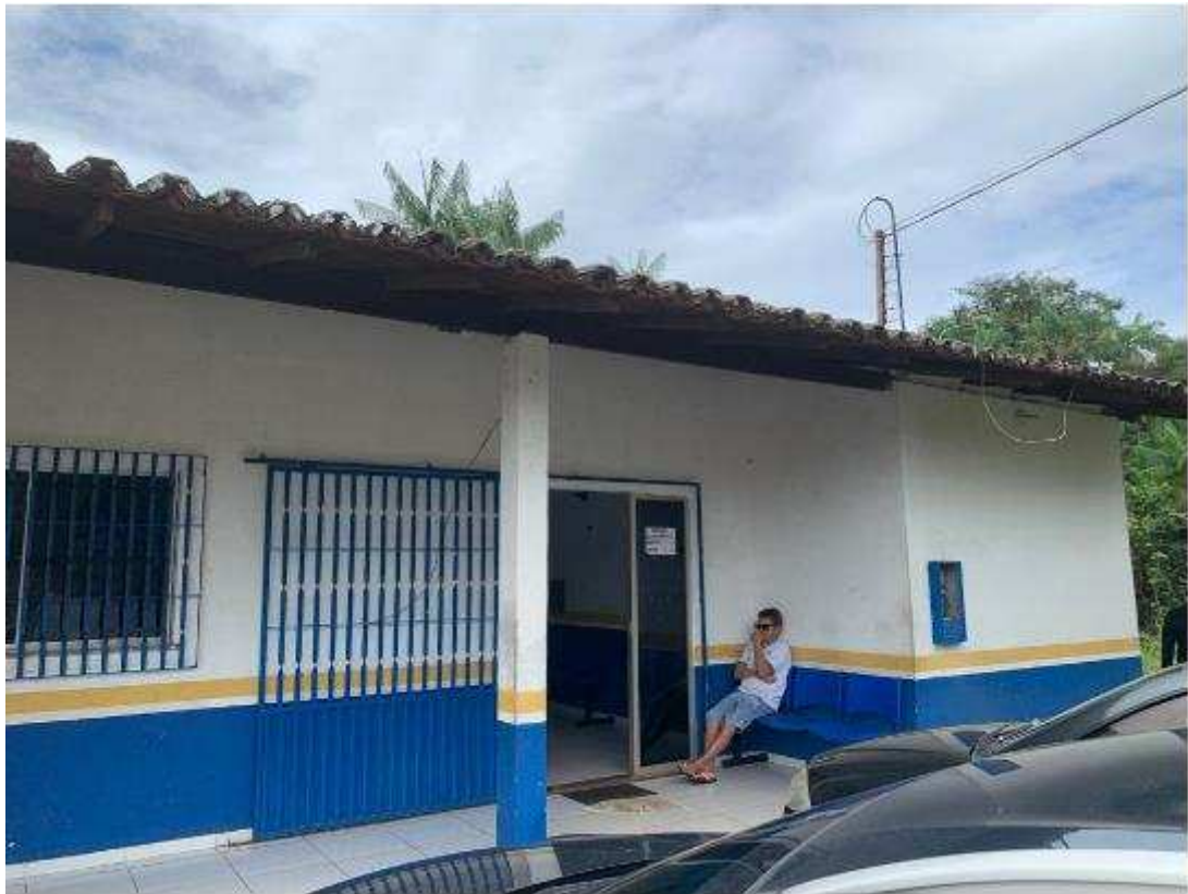
UBS - PINDOBA Rua Principal, n 140 - Pindoba