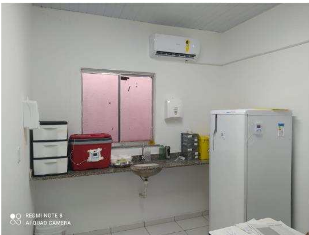
UBS - PINDOBA Rua Principal, n 140 - Pindoba