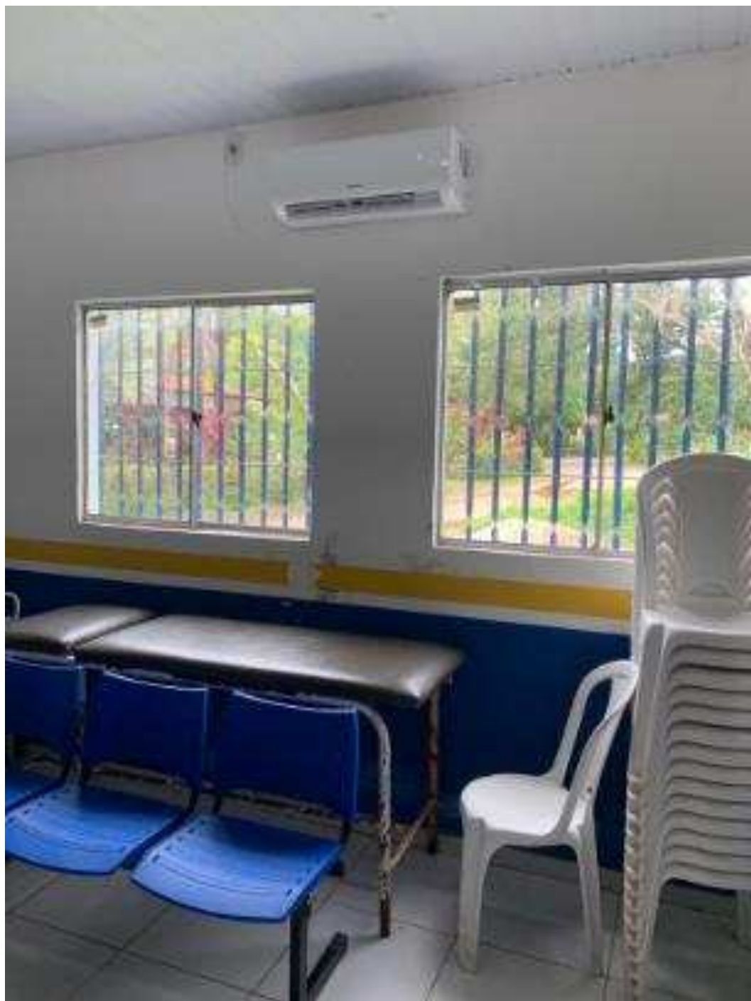
UBS - PINDOBA Rua Principal, n 140 - Pindoba