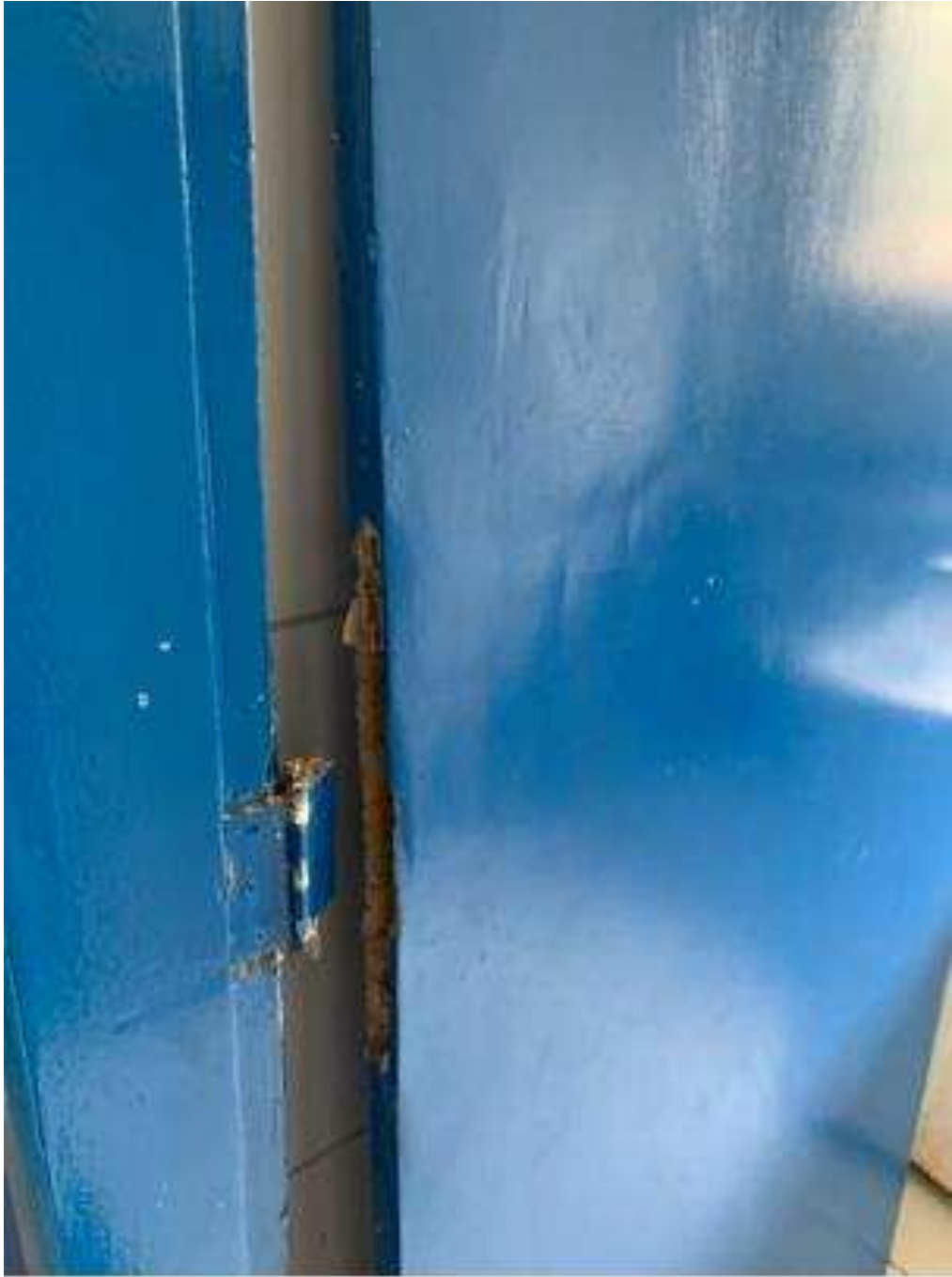
UBS - PINDOBA Rua Principal, n 140 - Pindoba