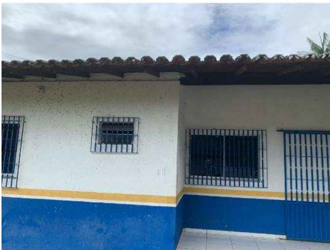
UBS - PINDOBA Rua Principal, n 140 - Pindoba