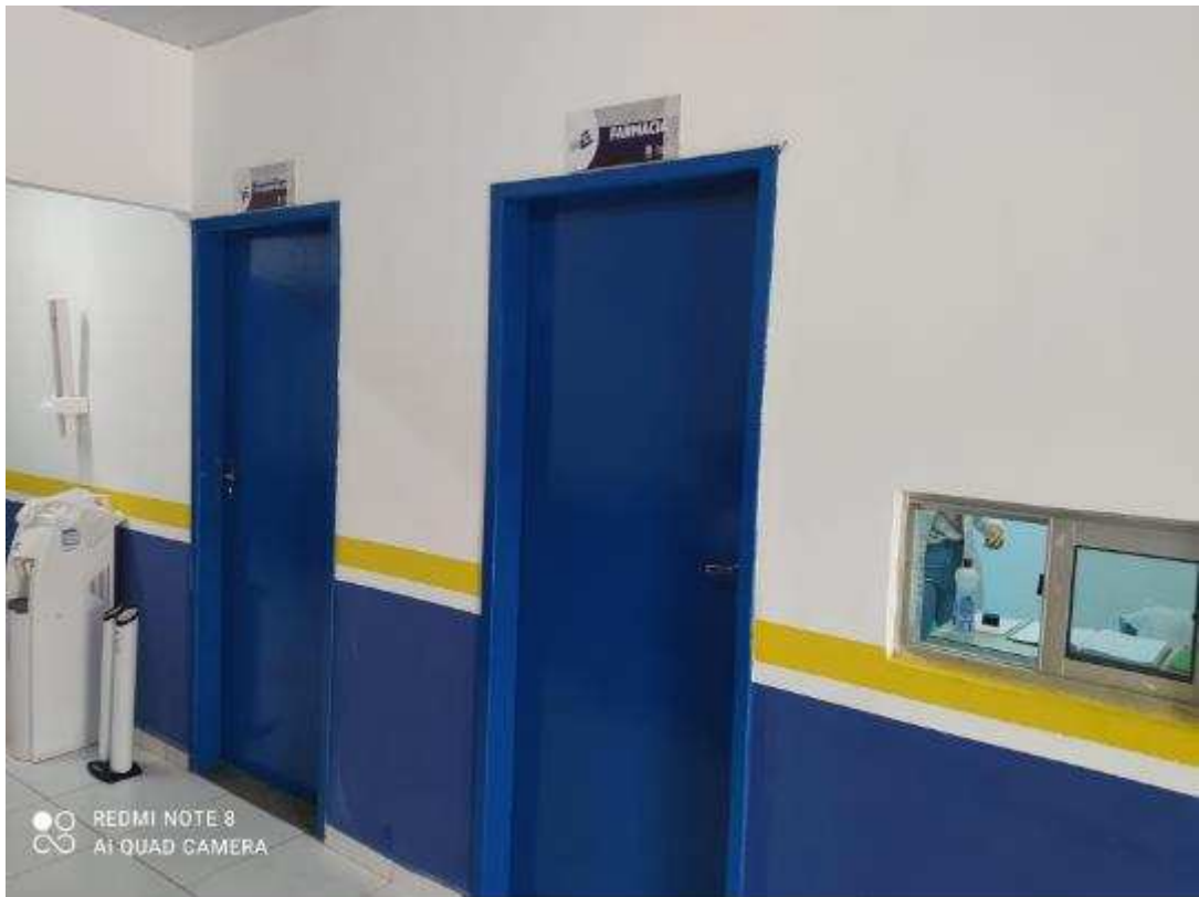
UBS - PINDOBA Rua Principal, n 140 - Pindoba