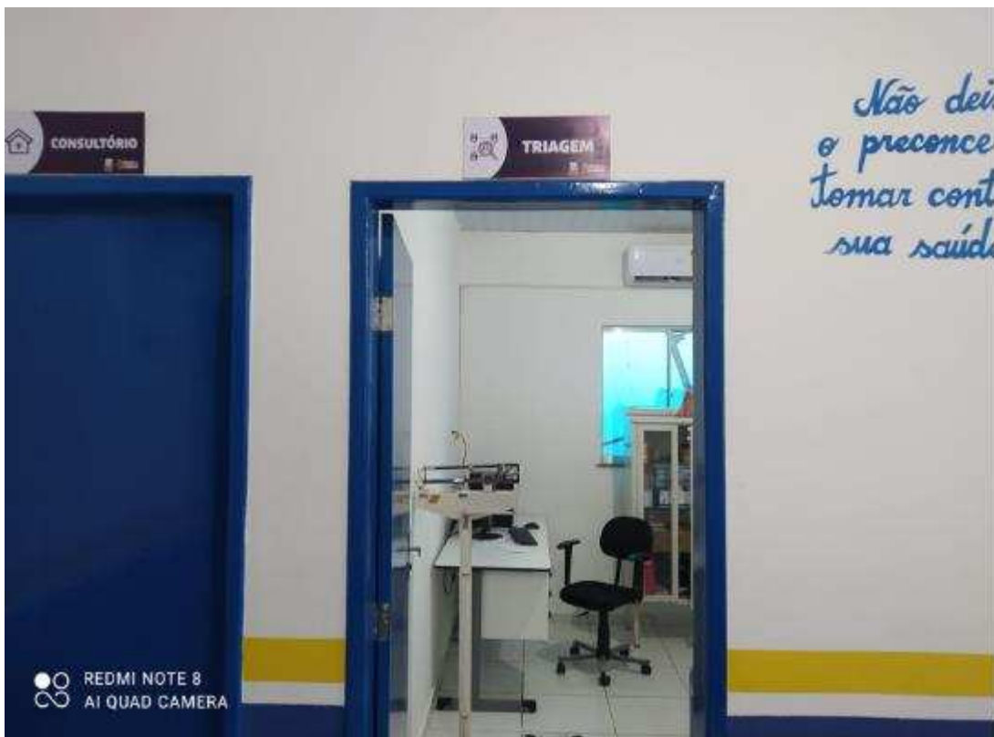
UBS - PINDOBA Rua Principal, n 140 - Pindoba