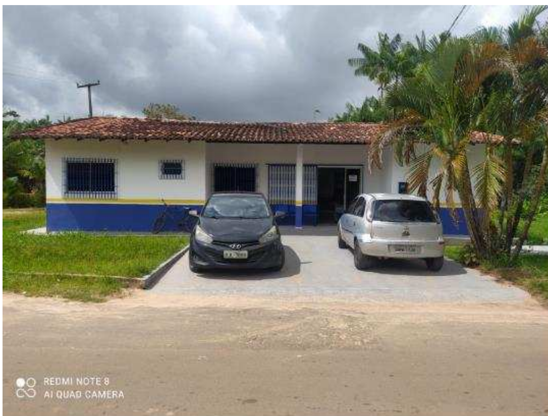
UBS - PINDOBA Rua Principal, n 140 - Pindoba