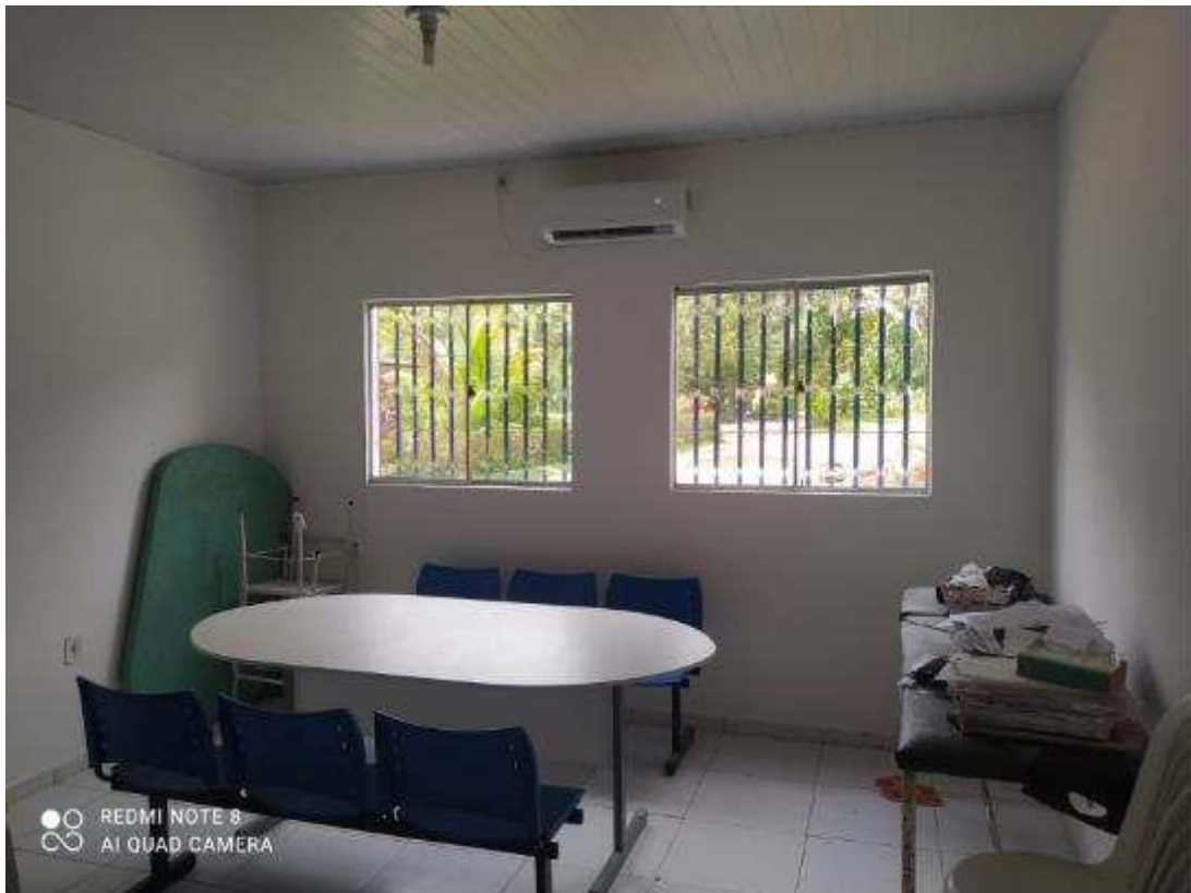
UBS - PINDOBA Rua Principal, n 140 - Pindoba