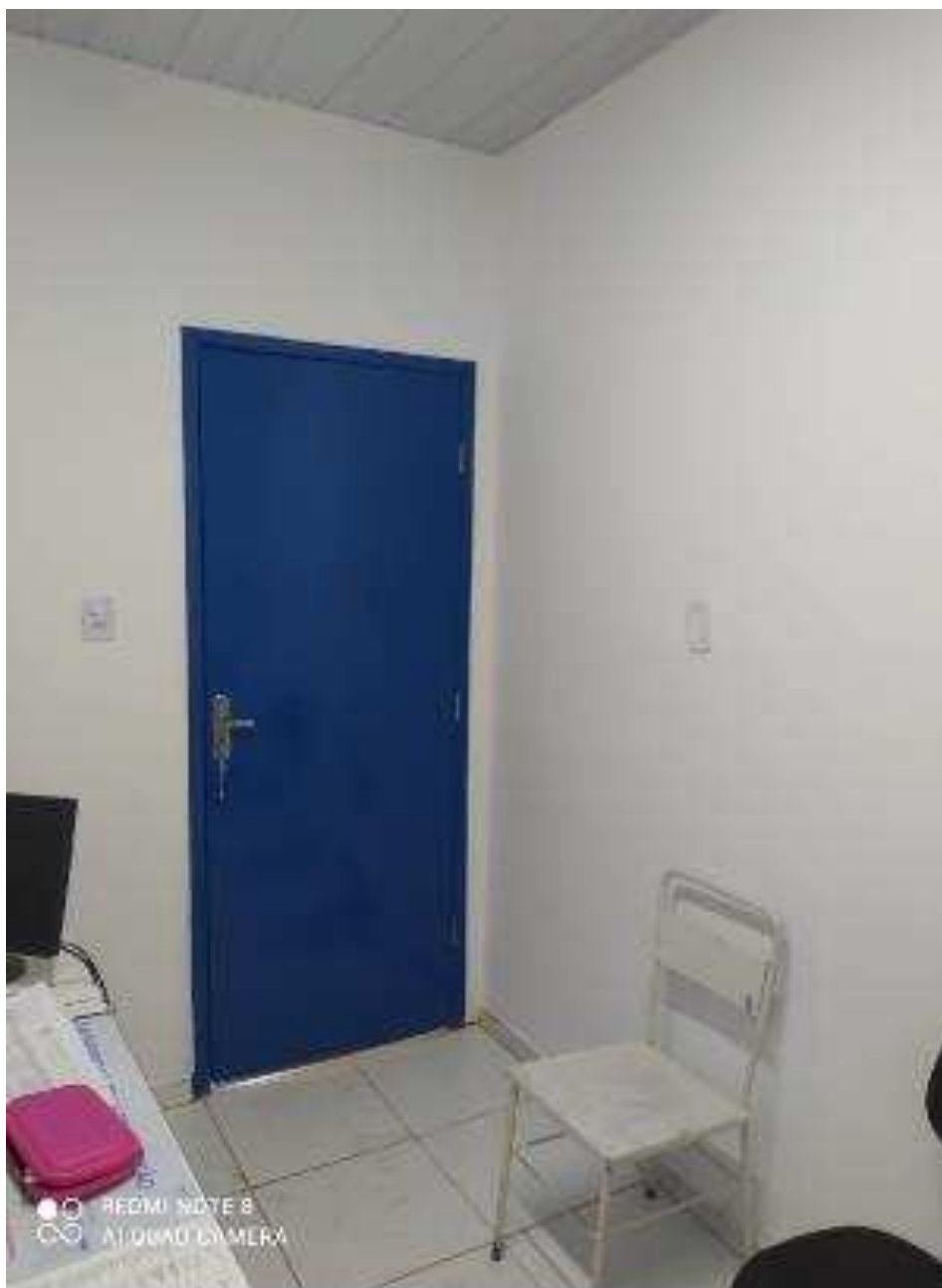
UBS - PINDOBA Rua Principal, n 140 - Pindoba