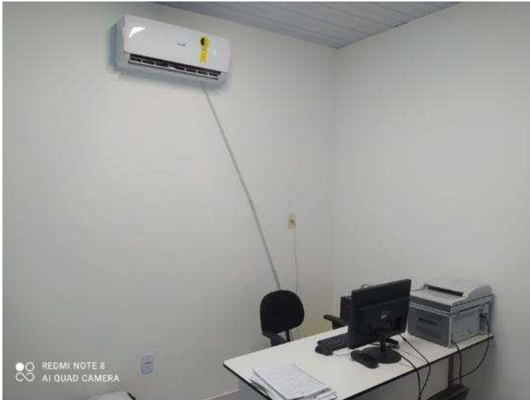
UBS - PINDOBA Rua Principal, n 140 - Pindoba