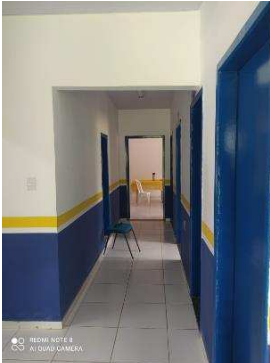
UBS - PINDOBA Rua Principal, n 140 - Pindoba