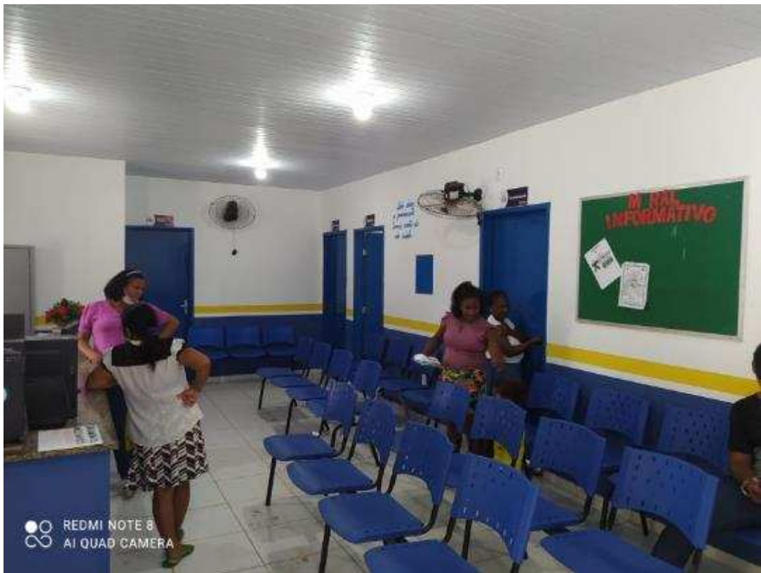
UBS - PINDOBA Rua Principal, n 140 - Pindoba