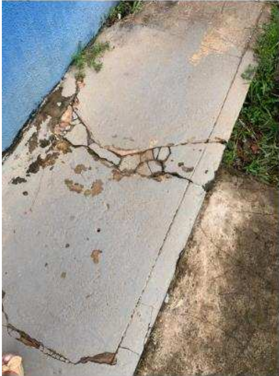
UBS - PINDOBA Rua Principal, n 140 - Pindoba