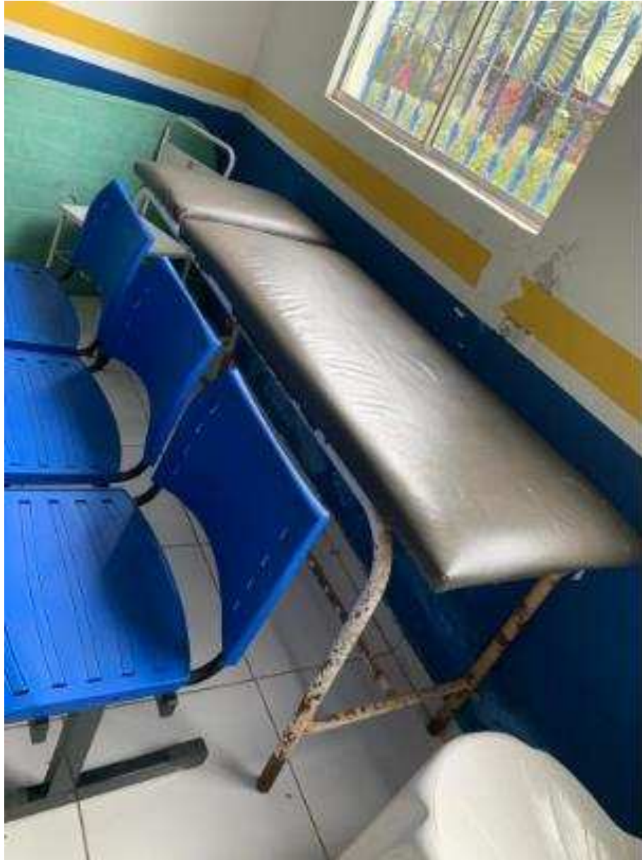
UBS - PINDOBA Rua Principal, n 140 - Pindoba