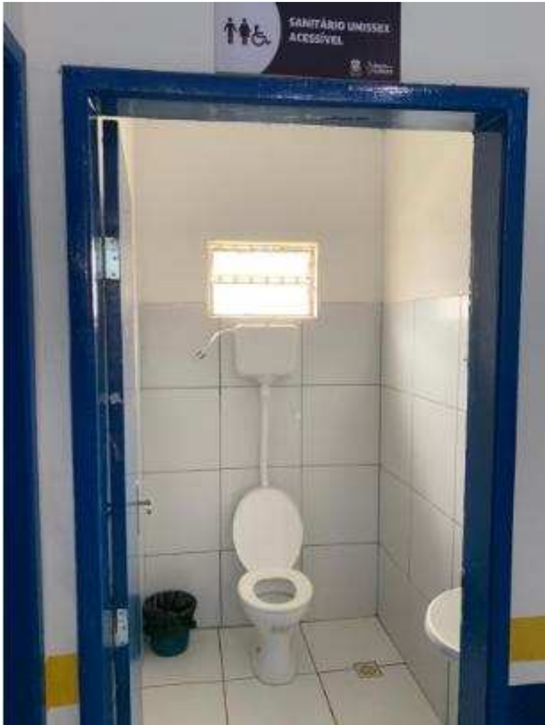
UBS - PINDOBA Rua Principal, n 140 - Pindoba