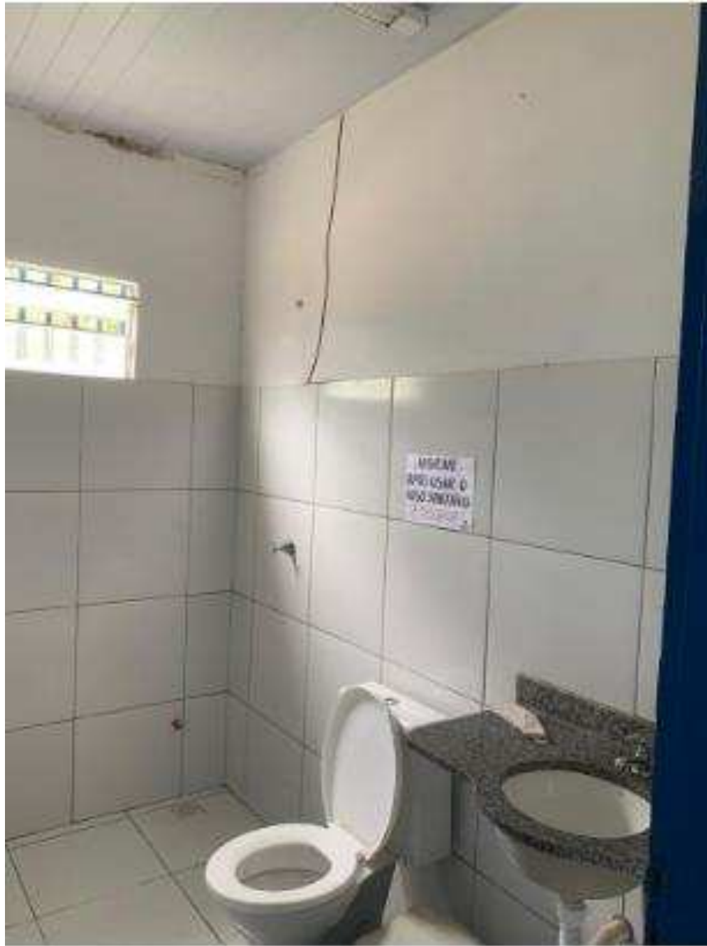
UBS - PINDOBA Rua Principal, n 140 - Pindoba