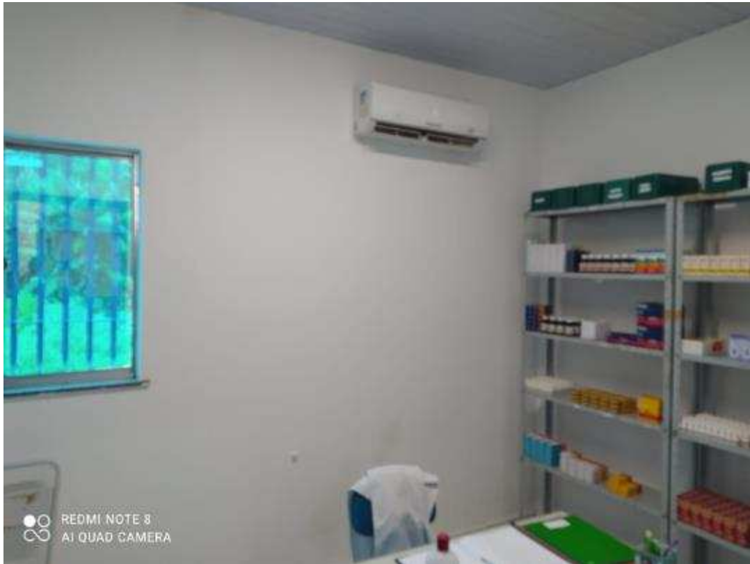
UBS - PINDOBA Rua Principal, n 140 - Pindoba